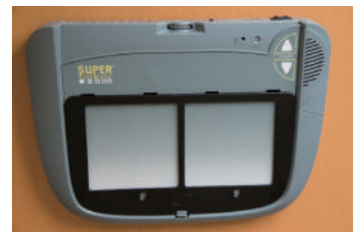
▲スーパーターカーVOCA (voice output communication aids)